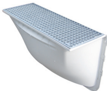
SIPHON DE COUR ANGLAISE AVEC CRÉPINE